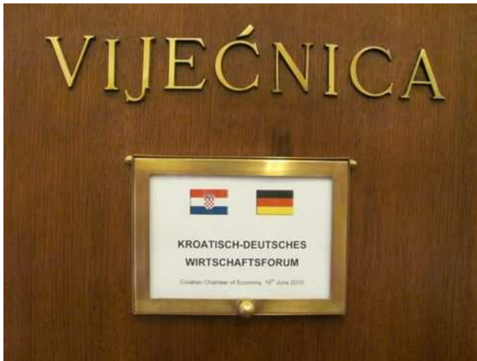
Veranstaltungsort Wirtschaftskammer.