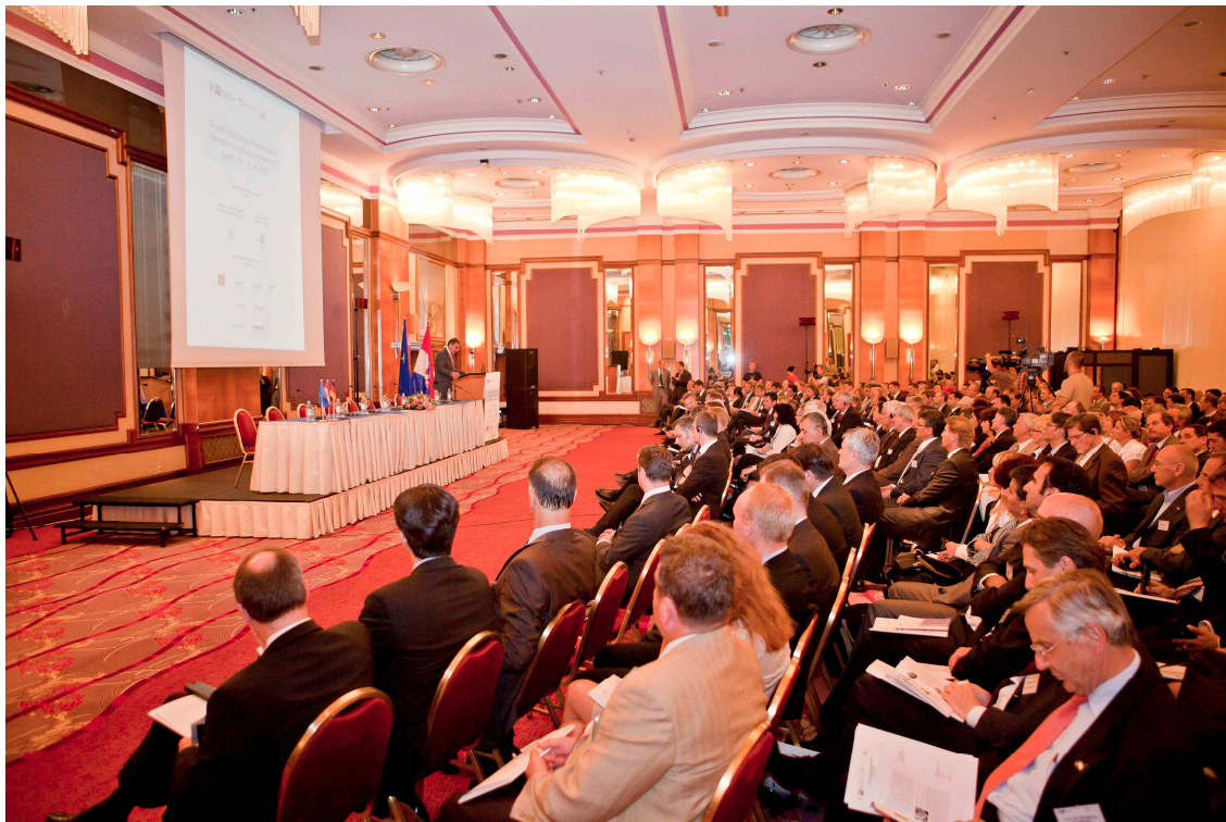
Eröffnungsveranstaltung im Hotel „Westin“