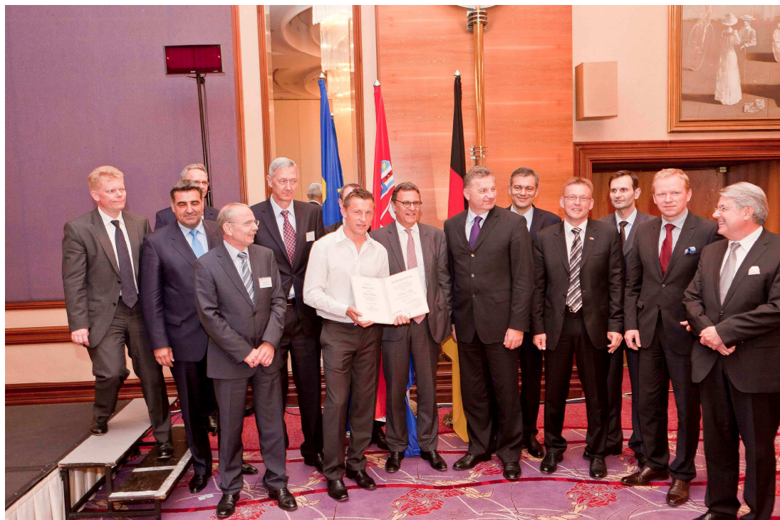
Ehrung für Bayer-Stürmer Ivica Olić.

Im Anschluss an die Diskussionsrunde wurde als Überraschungsgast Ivica Olić, kroatischer Stürmer des FC Bayern München, für seine Verdienste um die deutsch-kroatische Freundschaft geehrt.