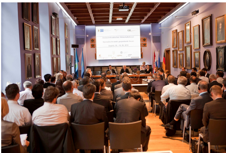
Panel zum Thema Industrie.

Abschließend wurde die Veröffentlichung eines Katalogs zum 17. Juni 2010 angekündigt, der alle Entwicklungsprojekte in Kroatien zusammenfasst und den Investoren erste Informationen an die Hand gibt.