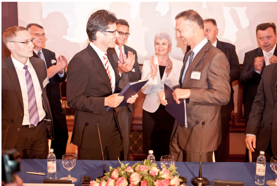
Vertragsunterzeichnung zwischen KfW und HBOR.

Im Anschluss kam es im Beisein der Ministerpräsidentin zur Unterzeichnung von Verträgen über zwei Globaldarlehen mit einem Gesamtvolumen von 50 Millionen Euro, die die deutsche KfW der kroatischen Förderbank HBOR zur Verfügung stellt, um zinsgünstige Kredite an kleinere und mittlere Unternehmen zu gewähren.