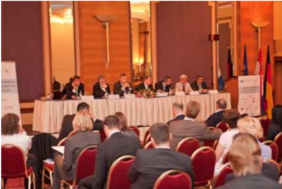
Veranstaltungsort Hotel Westin.

Am 16. Juni, dem zweiten Tag des Wirtschaftsforums, wurden in sechs Panels Branchenthemen vertieft, in denen die besten Aussichten für gemeinsame deutsch-kroatische Projekte bestehen. Jeweils zwei Panels fanden in der Universität Zagreb (siehe Foto), im Hotel Westin und in der Kroatischen Wirtschaftskammer statt.